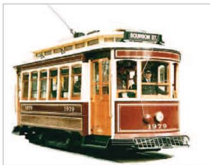
BERGENSTRIKK: Initiativtakerne sier det finnes forskjellige trikker over hele verden, og at Bergen kan få spesialbygd en helt egen bergenstrikk.

kroner, inkludert skinner og fire, nye trikker. Trikkene kan spesialkonstrueres for Bergen. I tillegg kan nostalgitrikke-ene på Møhlenpris brukes til bestemte formål på hele ruten. Det er også vår tanke at både turismen, kulturlivet og næringslivet langs linjen kan dra nytte av prosjektet. For det er på en slik måte vi to tenker at vi kanskje kan tjene penger på dette en gang, ved å tilby events på trikken, eller på stedene den stopper, utenfor de mest trafikkerte tidene, sier Bauge.